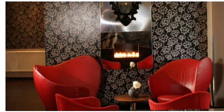
Radisson Blu Olympia