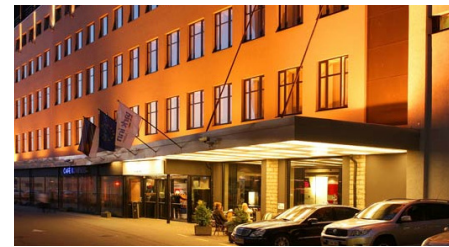
Park Inn Central